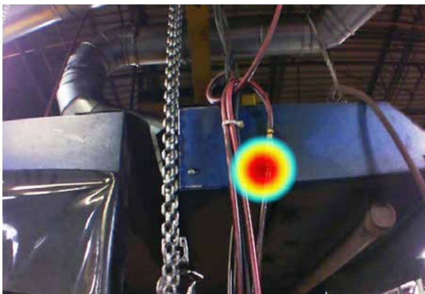
Snímky pořízené akustickou průmyslovou kamerou ii900 v průmyslovém prostředí.

Fluke. Keeping your world up and running. ®